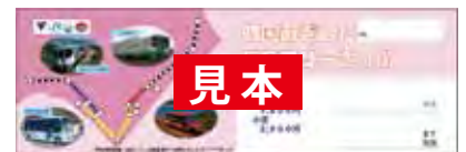
土佐くろしお鉄道・阿佐海岸鉄道発売 限定デザインきっぷ