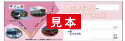
土佐くろしお鉄道・阿佐海岸鉄道発売 限定デザインきっぷ