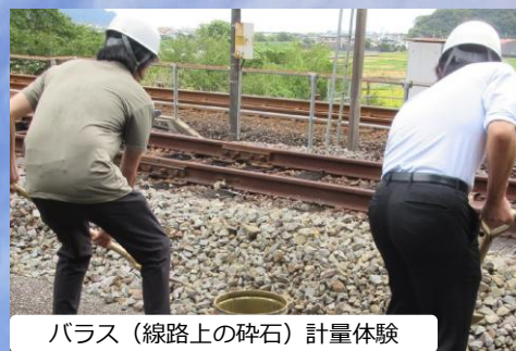
バラス(線路上の碎石)計量体験