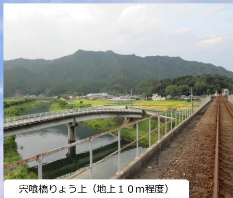
穴喰橋りょう上(地上10m程度)