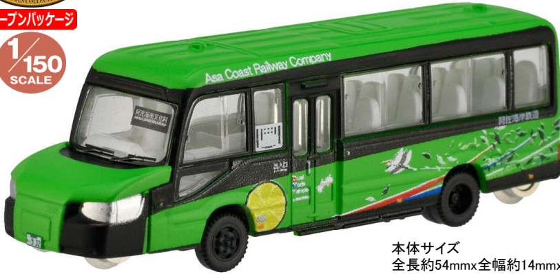
本体サイズ 全長約54mm×全幅約14mm×全高約18mm