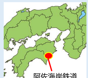
阿佐海岸鉄道 (徳島県・高知県)