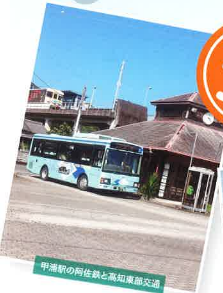
甲浦駅の阿佐鉄と高知東部交通